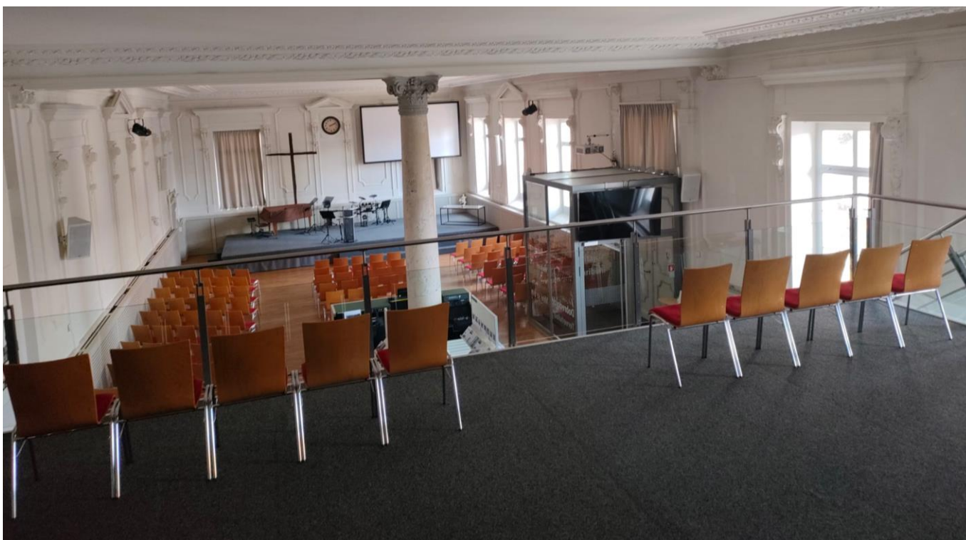
2x 5 Stühle