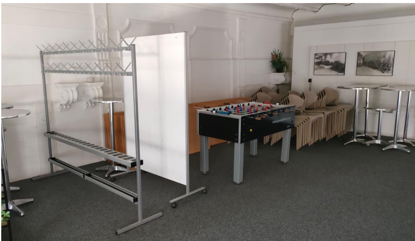
Garderobenständer – Pinwand – Tischlager/Stuhllager/Bistrotische – «Töggelikasten»